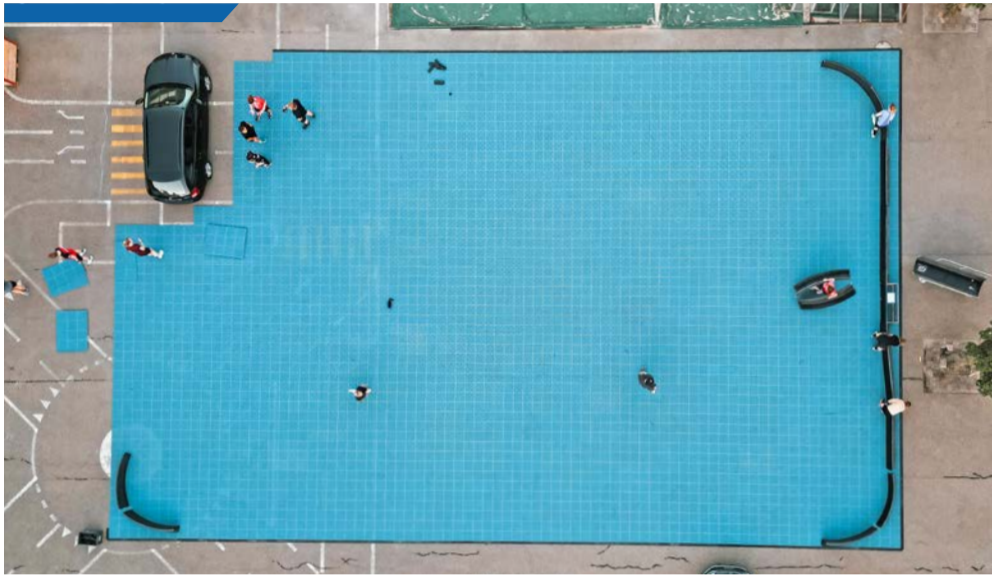
Street-Floorball-Feld im Aufbau.

Ab dem 22. Juli 2026 verwandelt sich der blaue Platz beim Schulhaus Busswil in ein sportliches Spielfeld: Eine mobile Street-Floor-Bahn lädt bis zum 26. August 2026 zum Spielen, Ausprobieren und Bewegen ein. Das Feld basiert auf einem modularen Click-System mit Bodenplatten und ist mit kleinen Toren ausgestattet – vergleichbar mit Unihockey, jedoch speziell für den Aus-senbereich konzipiert.