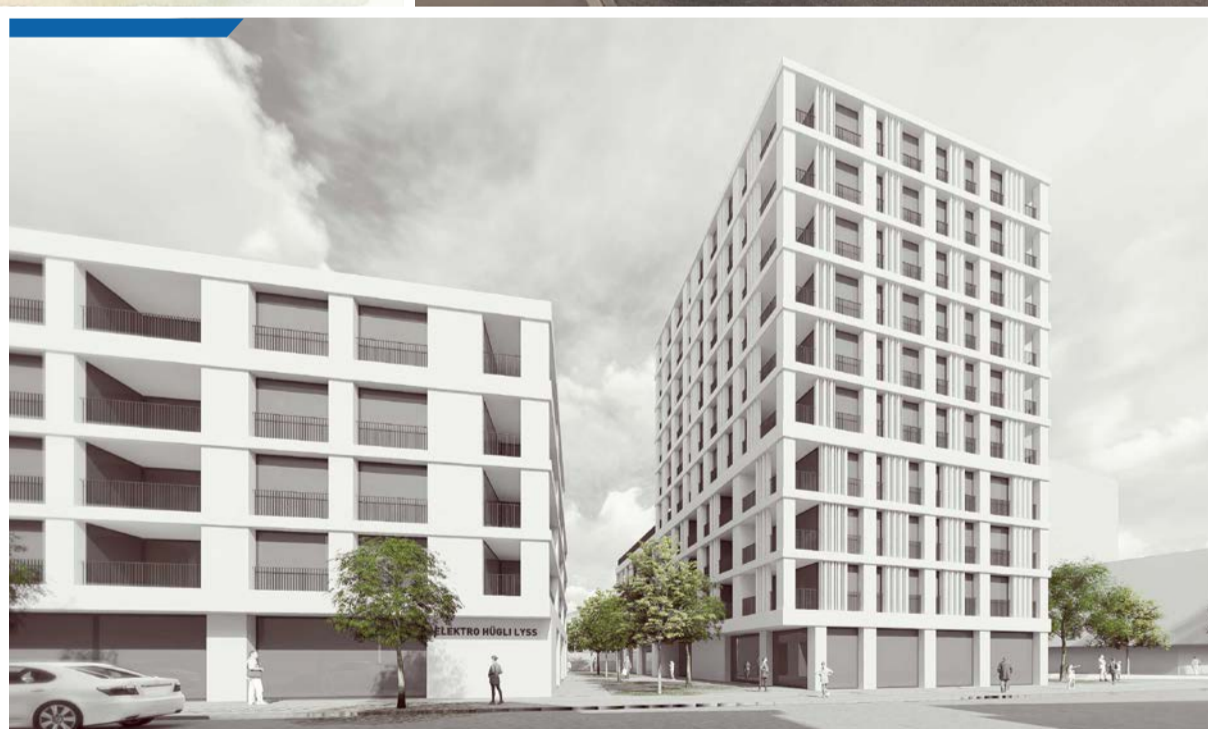
Fotos/Visualisierungen: Neues Seeland Center, Burckhardt Architektur AG (oben und Mitte links); Hochhaus Bahnhofstrasse/Steinweg, Play-Time Barcelona/GWJ Architektur AG (oben rechts); Areal Hauptstrasse 39-41, Sven D Meller - Architekt (unten)

Seite 2 NEUE TRUPPEN IN DER KASERNE LYSS