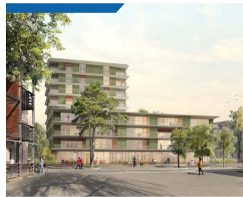
Wohnen am Mühleplatz. Visualisierung: 3B Architekten AG

Auch an anderen Orten wird geplant. Beim Seeland Center sind Erweiterungs- und Neubauten vorgesehen, die den bestehenden Einkaufsstandort zu einem urbaneren Zentrum weiterentwickeln sollen. Am Mühleplatz entstehen altersgerechte Wohnungen