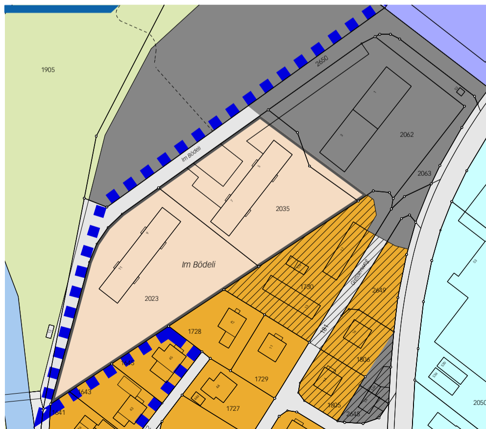
Aktueller Zonenplan Bödeli mit UeO 17 und ZöN 17 (vor Umzonung)

Die Ausschreibung startet am 15. April 2026. Der Entscheid fällt voraussichtlich im Herbst 2027, Baustart könnte ab 2029 sein. Bis dahin wird das Areal bereits genutzt: Geplant sind unter anderem eine Trainingsanlage der Hufiseler Lyssbach sowie ein Übungsgelände des Veloclubs Lyss.