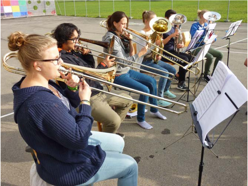
Üben im Freien

Heute umfasst der Verein rund 40 Mitglieder im Alter von 10 bis 22 Jahren.