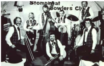
In den Anfängen