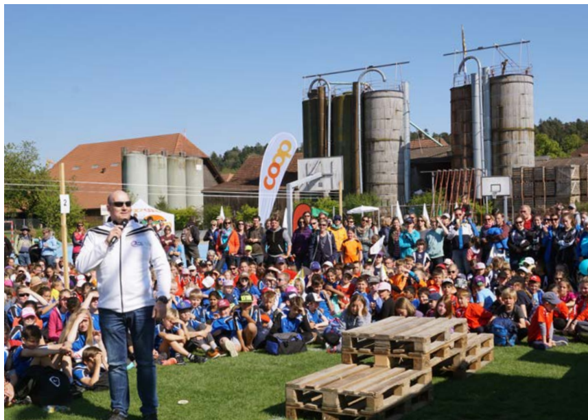
Spannung an der Rangverkündigung am Spieltag