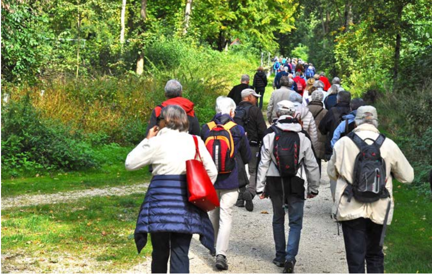
Unterwegs nach Lyss