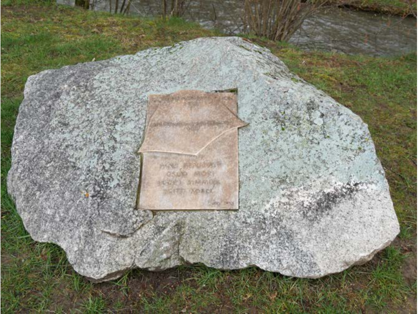
Gedenkstein Gründer Kasernenkorporation Lyss

kerungsteile nach wie vor mit zwei Standorten auf dem Sachplan Asyl aufgeführt. Derjenige betreffend Kappelen ist definitiv festgelegt und der Ausbau zum Bundesasylzentrum sollte im 2018 beginnen. Betreffend Zeughausareal besteht nach wie vor Hoffnung, dass Lyss