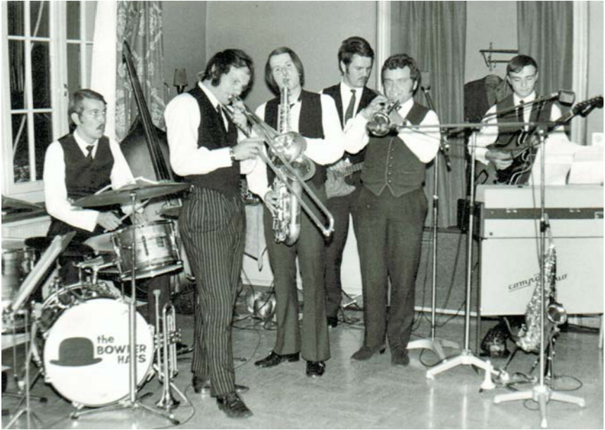
Bowler Hats in concert

getauscht. Es wurde ausgehoben, geschalt, betoniert und gezimert. Das ganze kostete nicht nur Schweiß sondern auch Geld.