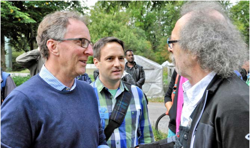
Gemeindepräsident, Projektleiter und Künstler im Gespräch