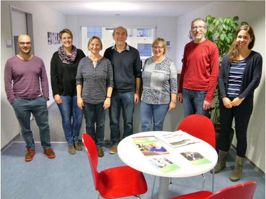
Das Team der Pro Senectute-Beratungsstelle Lyss

auch die beliebten Senioren-Tanznachmittage im Weissen Kreuz bezeichnen. Das Seniorentheater Lyss macht doppelt Vergnügen: den spielenden Seniorinnen und Senioren und den Zuschauenden.