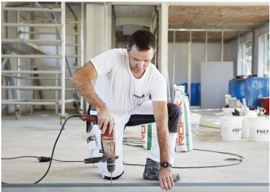
Exakte und massgenaue Montage von Metallständer im Trockenbau