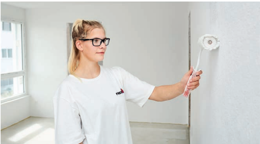
Farbanstrich in einem Neubauprojekt durch eine qualifizierte Mitarbeiterin

Spezialitäten. Dekorative Techniken gehören ebenso dazu, wie innovative Spezialbeschichtungen.