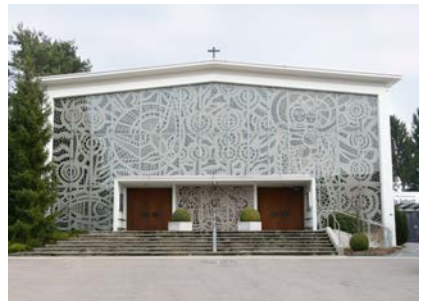
Marien-Kirche der RKK

Ein wichtiger Anlass ist auch die Feier zur Ankunft des Friedenslichts, die jedes Jahr vor Weihnachten in der röm. kath. Kirche stattfindet (siehe Kasten).