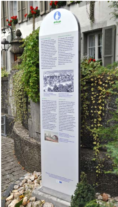
Eine der Informationstafeln steht beim Weissen Kreuz in Lyss

Heute erinnert der «Hugenottenweg» an das Ereignis. Unterwegs von Aarberg nach Lyss erfährt der Wanderer auf fünf Informationstafeln, was sich vor 330 Jahren ereignet hat. Ausgehend von der Kirche Aarberg führt der Weg hinunter