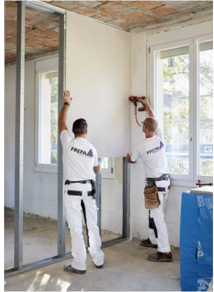
Ausführung Trockenbauarbeiten im Umbau

Das Portfolio der FREPA AG umfasst sämtliche klassische Gipserarbeiten von Nassputz über Trockenbau bis Fassadendämmung, aber auch Spezialitäten wie Brandschutz, Stuckaturen und neuerdings auch die Asbest-Sanierung.