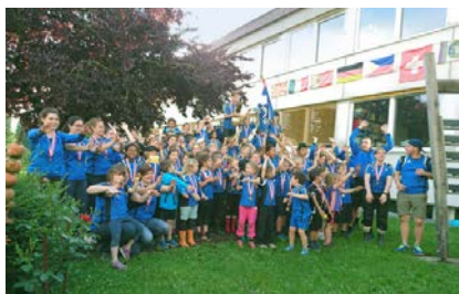
Erfolgreiche Mädchenriege zu Hause