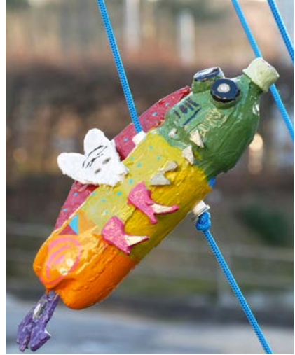
Von PET zu Chaotenfisch

leuchtende Holzkonstruktion, welche grosse Anforderungen an alle stellte.