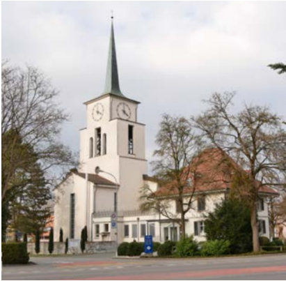
Grosse ref. Kirche

Zu den regelmässigen ökumenischen Angeboten für die Kirchen gehören: