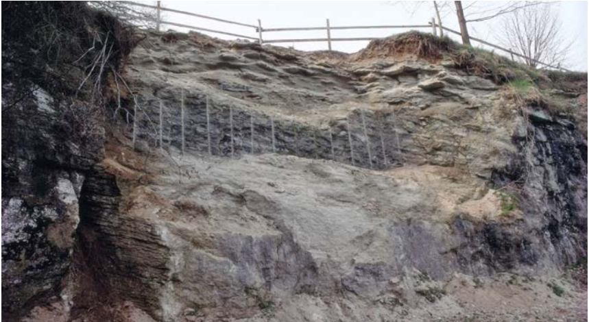
Steinbruch in Brüttelen

aufgenommen ist, haben Bund und Kanton einen Beitrag von gesamthaft rund 50 Prozent an die Restaurierungskosten in Aussicht gestellt.