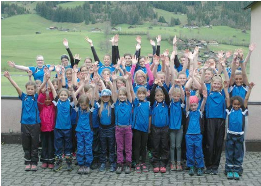
Gruss von der Jugi-Reise

die während 90 Minuten ihre Originalität unter Beweis stellten und sichtlich ihre Freude an dem gelungenen Anlass hatten.