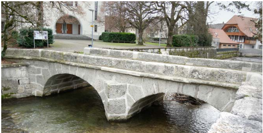
Bogenbrücke bei der Kirche

Der Brückenübergang war im Mittelalter Teil der Mittellandstrasse, die Frankreich über das Genferseegebiet mit der Nordostschweiz und Süddeutschland verband. Diese Strassenverbindung könnte jedoch schon in früherer Zeit bestanden haben. Nach dem ersten