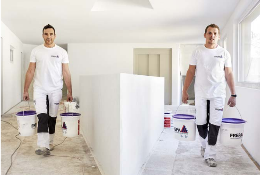
Motivierte FREPA-Mitarbeiter in der Arbeitsausführung

Bei der Malerei gibt es neben den traditionellen Angeboten im Neubau und beim Renovieren ebenfalls