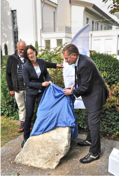
Stiftungsratspräsident, Regierungsstatt- halterin und Regierungsrat bei der Enthül- lung des Gedenksteins