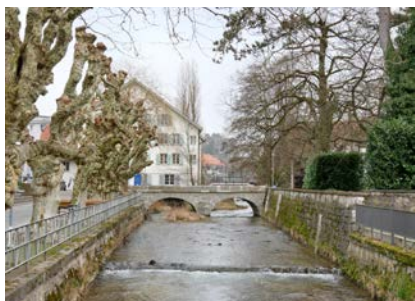
Lyssbach mit Bogenbrücke

Da die Bogenbrücke sowohl im Bundesinventar der historischen Verkehrswege der Schweiz (IVS) mit hohem Stellenwert (nationale Bedeutung mit Substanz) und im Inventar der Baudenkmäler des Kantons Bern als schützenswert