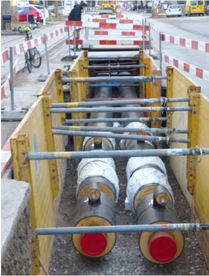
Vor- und Rücklaufleitung mit Anschlüssen für Endnutzer

Warmwasseraufbereitung sowie für Lüftungs- und Klimaanlage zu nutzen.