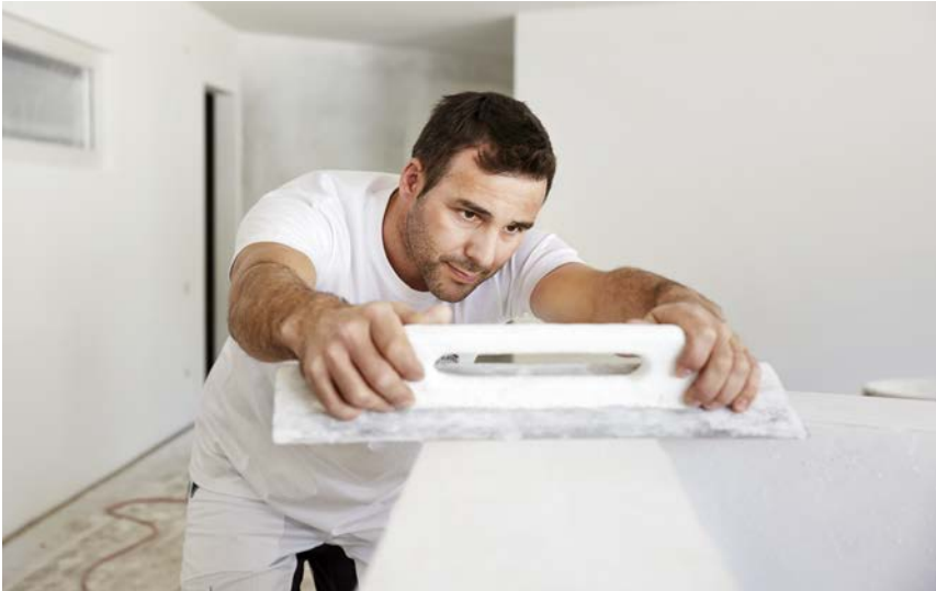
Hochwertiger Innenausbau durch einen qualifizierten FREPA-Mitarbeiter

ist bis heute in der Geschäftsleitung der Firma tätig. Das Unternehmen zog in den 80er Jahren an die Werkstrasse in Lyss. Auch beschloss man relativ bald eine Diversifizierung und so gesellte sich die FREPA MALEREI AG dazu. Beide Firmen haben je eine Filiale in Lyss und Biel, sind rechtlich selbstständige Unternehmen, treten aber unter dem gemeinsamen Namen auf. Der Malereibetrieb beschäftigt heute 30 Mitarbeitende, in der Gipserei sind es 120. Im Herbst 2016 konnte die Firma den Neubau an der Südstrasse 8 beziehen. Er bietet eine optimale Infrastruktur – etwa für die ausgeklügelte Lagerlogistik – und ist auf eine längerfristige Zukunft ausgerichtet. Der