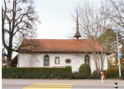
Alte ref. Kirche

Dieser Ausspruch von Ernst Hug fasst kurz und bündig das «Programm» der Lysser Kirchen zusammen.