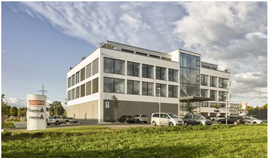
Büro- und Betriebsgebäude der FREPA AG an der Südstrasse 8 in Lyss

Der Name erklärt sich aus den Anfangsbuchstaben der drei Söhne: Franco, Enrico und Patric; letzterer