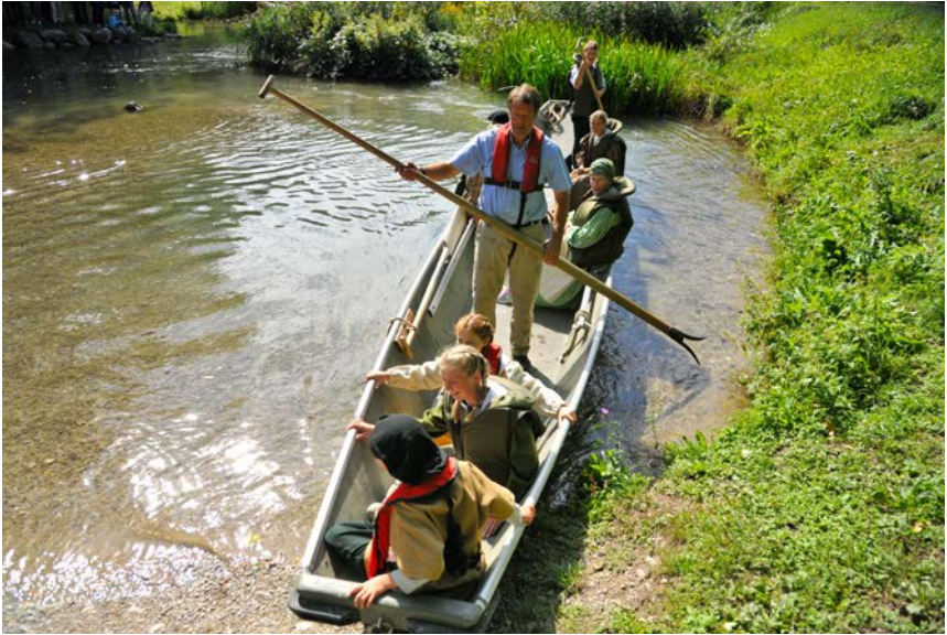
Aarefahrt wie vor 330 Jahren, allerdings vorschriftsgemäss mit Schwimmwesten

Kirche. Sie alle wollen teilnehmen an der Eröffnung des Hugenottenwegs von Aarberg nach Lyss.