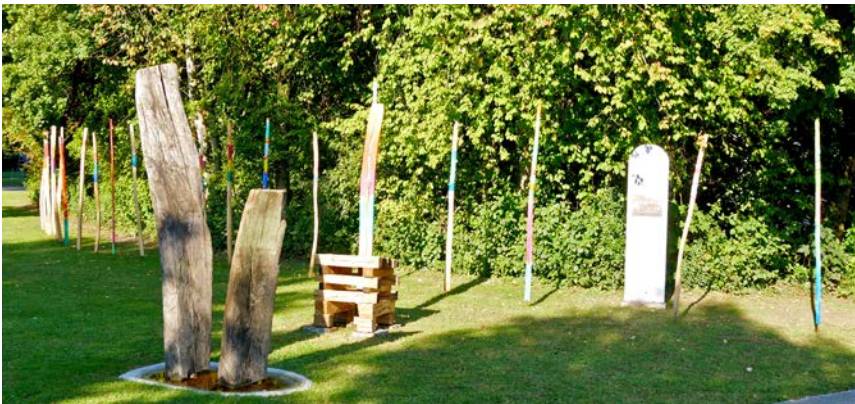
Die Installation «Naufrage Moment mal re garde» von Gianni Vasari erinnert an das Schiffsunglück von 1687

16. September 2017: Die Kirche Aarberg ist fast bis auf den letzten ihrer dreihundert Plätze besetzt. Aus der ganzen Schweiz sind sie gekommen – aus Genf gar mit einem grossen Car –, aus Frankreich, Deutschland, Holland, Luxemburg, und viele aus der Region, darunter auch Autoritäten aus Politik und