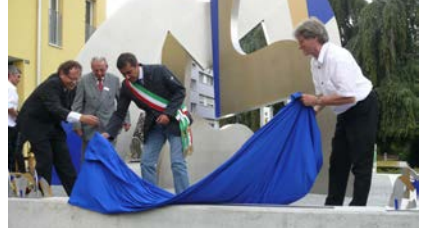
Das Denkmal am Monopoliplatz in Lyss wird enthüllt

2009 , im Rahmen der 1000-Jahr-Feier von Lyss, wurde der Monopoli-Platz beim Bahnhof offiziell eingeweiht. Der heutige Lysser Ehrenbürger und Feintool-Gründer Fritz Bösch spendete das Denkmal «Lyss-Monopoli». Vor Ort war auch eine Delegation der Gemeinde