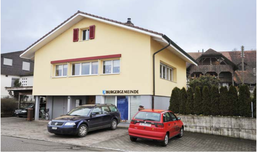
Die Burgerschreiberei an der Bahnhofstrasse