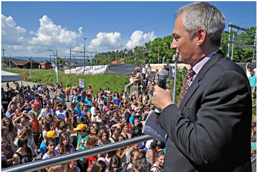
Schlussevent mit Regierungsrat Bernhard Pulver

Im Rahmen der Veranstaltung wurden gegen 90 Vertreterinnen und Vertreter aus Politik, Gemeinden und Sport begrüsst. Für sie wurde ein abwechslungsreiches Rahmenprogramm organisiert, unter anderem mit einem offiziellen Apéro im Hotel «Weisses Kreuz», mit geführten Touren zu den verschiedenen Sportstätten oder einem Dessertbuffet im Lyssbachpark. Zu den Höhepunkten zählte die Ansprache von Regierungsrat Bernhard Pulver am Schlussevent.