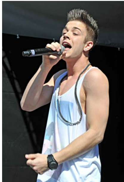
Publikumsmagnet Luca Hänni