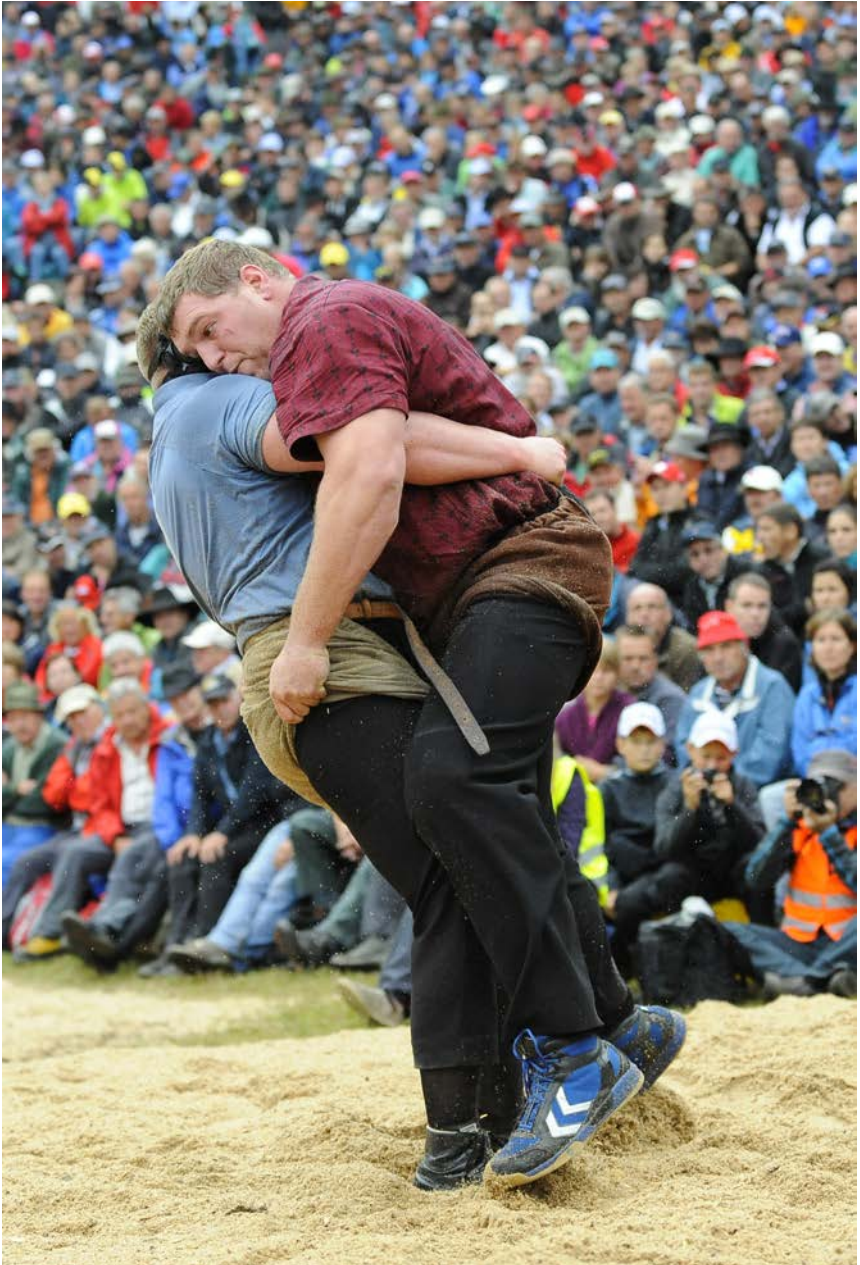
Faszinierende Kampf Stimmung