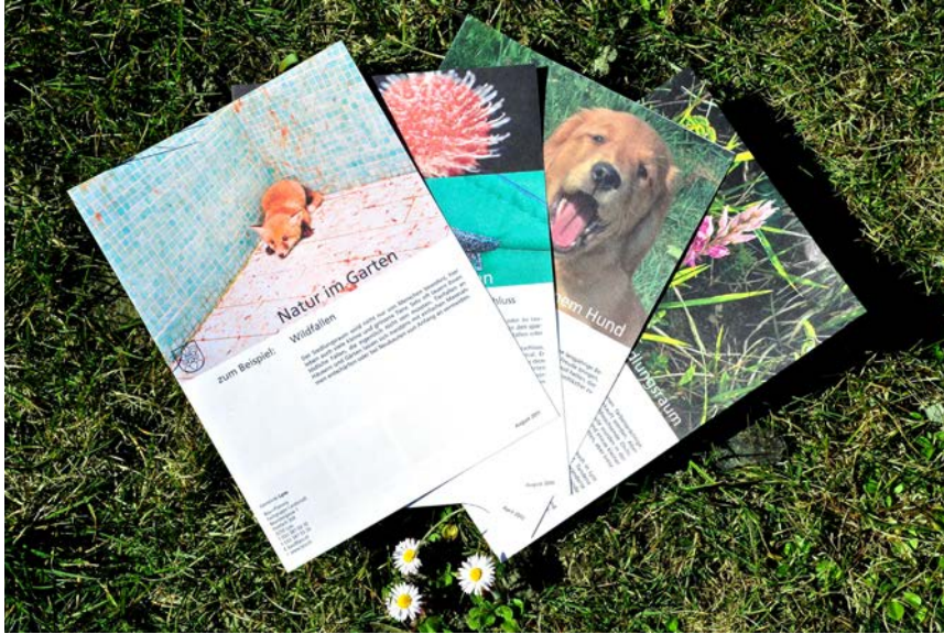
Informationsbroschüren der Fachgruppe Landschaft

Aare bis zu Orchideen – um nur eine Auswahl vorzustellen. Parallel dazu wird jedes Jahr und nach Möglichkeit zum aktuellen Thema eine Exkursion angeboten. Nicht jedes Thema stösst auf gleich viel Interesse. An der Führung über «Wildblumen und Gartenzwerg» nahmen zum Beispiel nur fünf Interessierte teil, während Exkursionen zu Themen wie Fledermäuse, Orchideen oder Klimawandel im Wald mit je 60 bis 70 Personen auf erfreulich grosses Interesse stiessen.