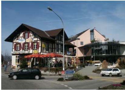
Glaser-Neubau im Hintergrund