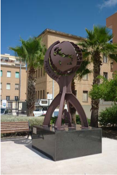
«Piazza di Lyss» in Monopoli

2013 konnte das 30-jährige Jubiläum der Verschwisterung gefeiert werden. Am 7. September fand auf dem Lysser Monopoli-Platz ein grosses Fest mit verschiedenen Darbietungen statt, an dem rund 300 Personen teilnahmen. Begrüsst wurde auch die Velogruppe von Filippo Larizza, die in einer begleiteten Nonstop-Fahrt von Monopoli nach Lyss gefahren war. Am folgenden Morgen reiste wieder eine Schulklasse für eine Ferienwoche nach Monopoli.