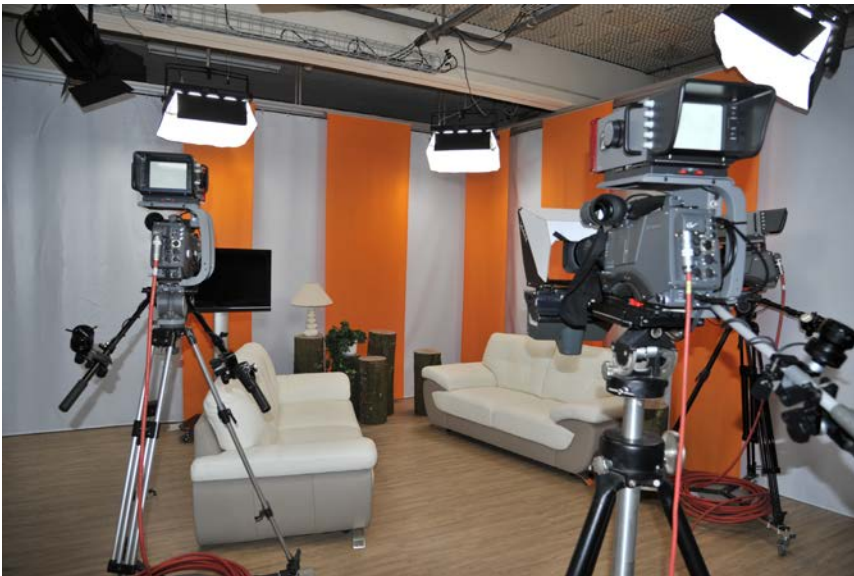
Das LOLY-Studio, wie es sich seit 2013 präsentiert

1999 ist für LOLY ein ereignisreiches Jahr. So wird das bis anhin jüngste LOLY-Mitglied in den Verein aufgenommen, der 15-jährige Lysser