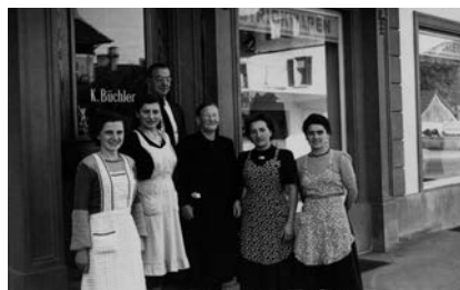
Mitarbeitende Modehaus Büchler