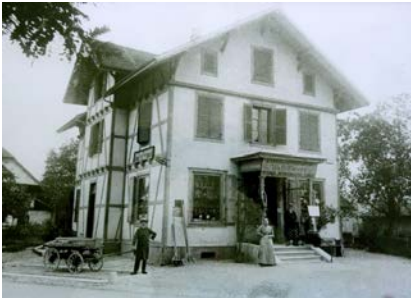
Die Glaser AG anno 1939

Das Lysser Traditionsunternehmen Glaser AG wurde 1939 gegründet. Gemäss Handelsregistereintrag war die Firma zunächst in den Sparten Beleuchtung und Haushaltsartikel tätig und beschäftigte 25 Mitarbeitende. Die Glaser AG florierte und baute ihr zentral gelegenes Geschäft am Hirschenplatz zunehmend aus: Eisenwaren, Sport- und Freizeitartikel, Gartenmöbel sowie Brennstoffe und Autozubehör kamen im Laufe der Jahre dazu. Ende der Neunziger platzte der Laden aus allen Nähten und die Glaser AG beschloss, direkt hinter dem aktuellen Geschäft einen Neubau zu errichten. Das alte Gebäude wurde von der Denkmal-