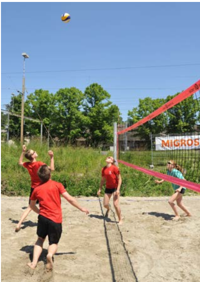
Beachvolleyball in Lyss

Dank dem Einsatz der Disziplinenverantwortlichen und der regionalen Unterstützung der Sportplatzverantwortlichen vor Ort fanden die Sportlerinnen und Sportler überall bestens vorbereitete Sportanlagen vor. Erfreulich waren auch die überzeugenden sportlichen Leistungen; überall wurde mit grossem Einsatz um die Medaillenkämpfe gekämpft. Und die Freude war gross, als die Beachvolleyball-Mannschaft der Real- und Sekundarschule Aarberg auf der ganzen Linie siegte und in dieser Disziplin verdienter Schweizer Meister im Schulsport 2013 wurde.