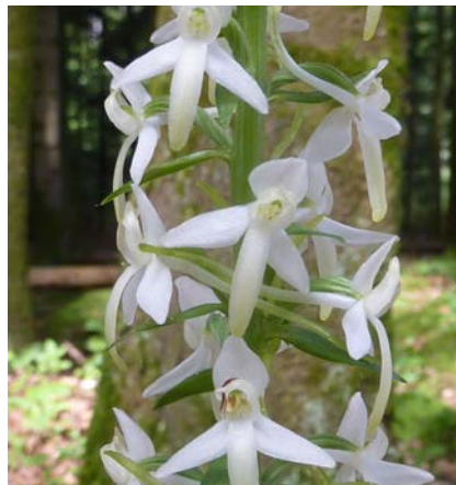
Orchideen in Lyss

Aare bis zu Orchideen – um nur eine Auswahl vorzustellen. Parallel dazu wird jedes Jahr und nach Möglichkeit zum aktuellen Thema eine Exkursion angeboten. Nicht jedes Thema stösst auf gleich viel Interesse. An der Führung über «Wildblumen und Gartenzwerg» nahmen zum Beispiel nur fünf Interessierte teil, während Exkursionen zu Themen wie Fledermäuse, Orchideen oder Klimawandel im Wald mit je 60 bis 70 Personen auf erfreulich grosses Interesse stiessen.