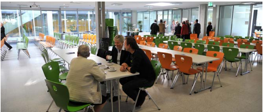
Das sanierte Berufs- und Weiterbildungszentrum (oben) mit neuer Kantine (unten)