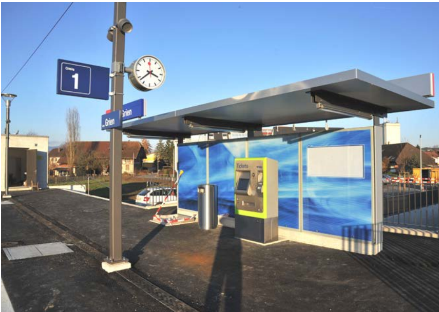
Haltestelle «Lyss Grien»

Die 5,4 Millionen Franken teure Anlage besteht aus einem 120 Meter langen Aussenperron, zwei Treppezugängen, einer Rampe sowie einer fünf Meter breiten Perso-