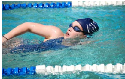
Wettkampfdisziplin in Aarberg