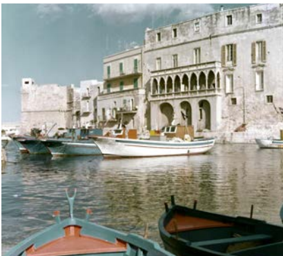
Malerische Schwesterstadt Monopoli