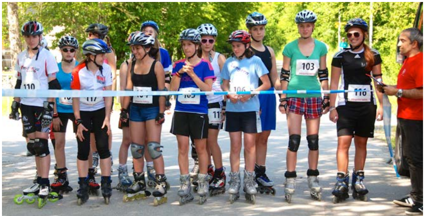
Spannung vor dem Start bei idealen Wetterbedingungen

Startschuss für den Grossanlass Bereits am 11. August 2011 hatten die ersten Gespräche stattgefunden, nachdem Lyss offiziell angefragt worden war, den Grossanlass durchzuführen. Noch mussten die Unterstützungszusagen von