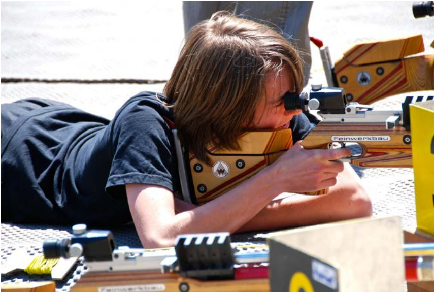
Spannendes Rahmenprogramm mit Swiss-Olympic-Disziplinen

Für die Verpflegung stand ebenfalls eine kooperative Partnerin zur Seite: die Lysser Migros-Filiale stellte nicht nur die Verpflegung für sämtliche Teilnehmer, Betreuer und Helfer zur Verfügung, sie war auch massgeblich an der Verteilung an die verschiedenen Standorte beteiligt.