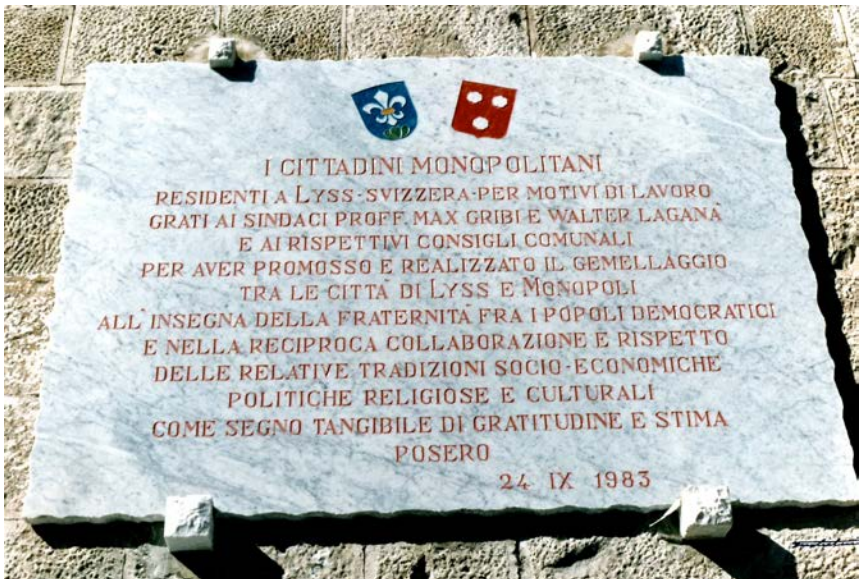
In Stein gemeisselt: Die Verschwisterung für alle sichtbar in Monopoli

Bereits 1983 reiste eine Delegation des Gemeinderates von Lyss nach Monopoli, um die Verschwisterungsurkunde zu unterschreiben. Die Unterzeichnung fand grösste Beachtung, auch bei der lokalen Prominenz, und wurde sogar live im Fernsehen übertragen. Ein Glückwunschtelegramm von Minister Giulio Andreotti an den damaligen