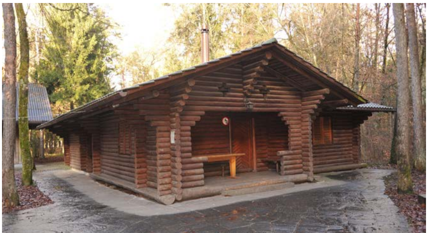
Heimliches Hauptquartier der Busswiler Burger

Der Burgerrat hat seine monatliche Sitzung noch nicht beendet.