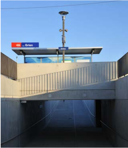
Die neue Unterführung

Finanziert wurde die Haltestelle zu 60 Prozent durch den Kanton und zu 40 Prozent durch die Gemeinde. Die Haltestelle ist seit dem Fahrplanwechsel vom 15. Dezember 2013 in Betrieb.