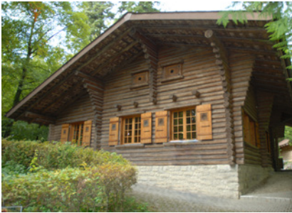
Das Lysser Waldhaus

an Lysser Burger mit mehr als fünf Jucharten 1 Landbesitz. Der letzte Drittel wurde den Personalberechtigten zugeteilt, d.h. den Holznutzungsberechtigten mit weniger als fünf Jucharten Land. Das waren die Personalburger von Lyss, die noch heute in der Personalwaldkorporation zusammengeschlossen sind.