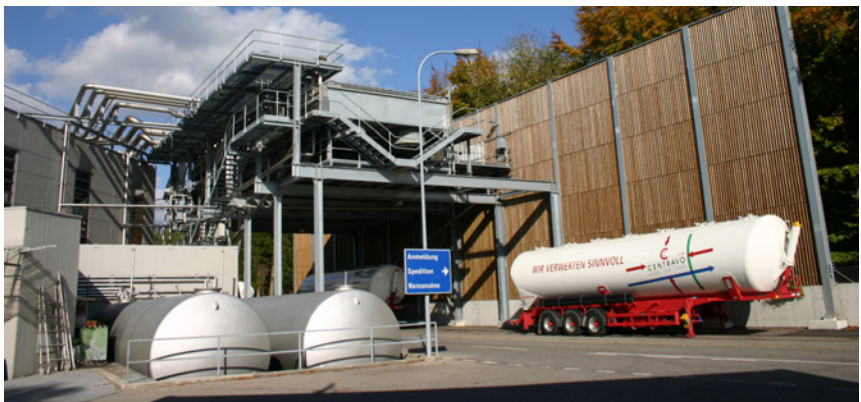
Die GZM am Industriering 24: Im Vordergrund und auf dem Dach befinden sich die Container für die Abluftreinigung

Diese aus hygienischer Sicht mehr als fragwürdige Praxis war in der Schweiz noch bis nach dem 2. Welt-