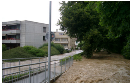
Wassermassen bei der Alterssiedlung