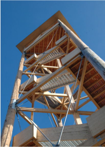
Der Lysser Aussichtsturm

Dass die Personalburger von Lyss heute relativ unbekannt sind, ist in erster Linie auf die beschränkten finanziellen Mittel zurückzuführen. Die PWK kümmert sich vornehmlich um den Lysser Wald, vermietet eine Liegenschaft in der Hardern und nutzt neben den vier grossen Parzellen zusätzlich vier weitere, eigene Waldparzellen.