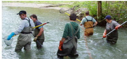
Kontrollabfischung Alte Aare (2004)

Im Jahr 1976 kommt der Winigraben und nochmals zehn Jahre später, 1986, der Schmiedebach dazu. Mit der Fischeaufzucht versucht man, dem Fischrückgang entgegenzuwirken, die Eigenfortpflanzung zu unterstützen und eine nachhaltige Nutzung zu gewährleisten.