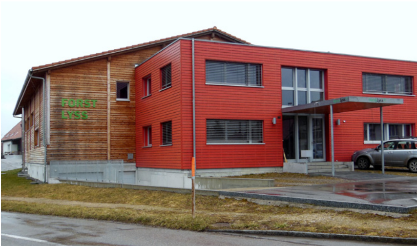
Das Betriebsgebäude in der Hardern

Die Pflege und die nachhaltige Nutzung der Waldgebiete wird auch in Zukunft die Hauptaufgabe der Lysser Burger sein. Die PWK verfolgt deshalb langfristige waldbauliche Zielsetzungen und eine nachhaltige und wirtschaftliche Nutzung des Lysser Waldes unter Erhaltung der Biodiversität. Ihr Forstbetrieb bringt dafür das notwendige Wissen und eine langjährige Erfahrung mit. Den Nutzen haben die Lysserinnen und Lysser, für die ihre Wälder ein wichtiges Naherholungsgebiet sind.