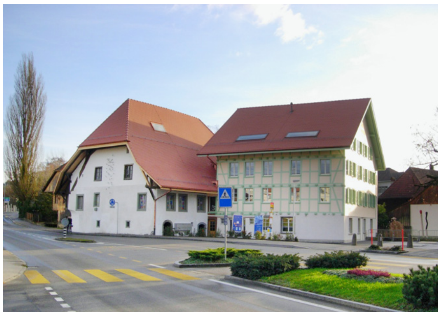
Kulturwerkstatt untere Mühle Lyss

Im August 2001 fusionieren das Kunstkollegium Lyss und die Mühlegesellschaft, die anlässlich der Ausstellung «Häb Sorg zum Wasser» gegründet worden ist, zum Kulturkollegium. In der Zwischenzeit kann die Gemeinde Lyss nach jahrelangen Verhandlungen