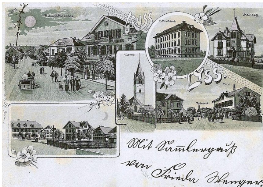
Alte Postkarte aus Lyss