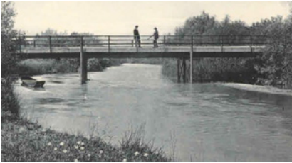
Brücke Lyss-Worben um 1912

Pächter. Aus diesem Grund entstehen die drei Fischereivereine Lyss, Aarberg und Büren.