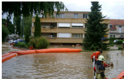
Einsatz der Hilfskräfte im Stegmattquartier