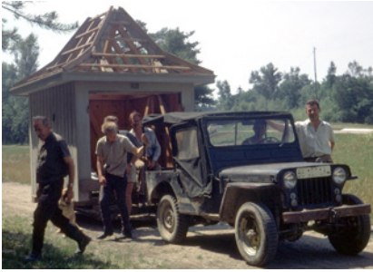
Das Spritzenhäuschen zieht um (1970)