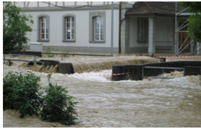
Lyssbach beim Herrengass-Schulhaus

Fünf Jahre nach diesem Jahrhunderthochwasser konnte die Ge-