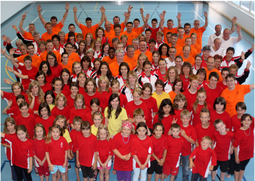
Fröhliche Gesichter nach einem gelungenen Turnfest

Über 500 Helferinnen und Helfer nehmen am Fest in der Rollhockeyhalle in Diessbach teil. Das Fest ist ein Dankeschön an die vielen Freiwilligen, die mit Elan und Freude zum guten Ablauf der Seeländischen Turntage beigetragen haben. «Klein, aber fein!» war in jeder Hinsicht ein voller Erfolg.