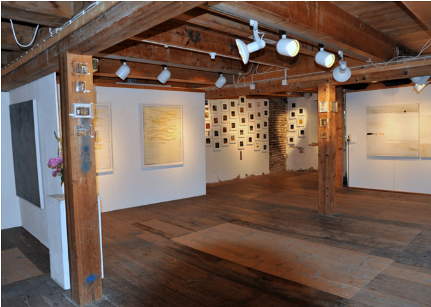
Ausstellungsraum untere Mühle Lyss

die untere Mühle kaufen, das älteste, weltliche Gebäude in der Gemeinde. Um die Räumlichkeiten der stillgelegten Mühle zu beleben, wird im April 2002 die Kulturwerkstatt gegründet. Ihr Zweck: Förderung des kulturellen Lebens in der Region, Organisation von Veranstaltungen mit Schwerpunkt Handwerk, Schaffung einer Kunstsammlung von Kunstschaffenden der Gegenwart.