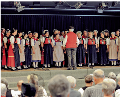
Für alle Gruppen waren die Liedervorträge das wichtigste Ereignis während des Festes.