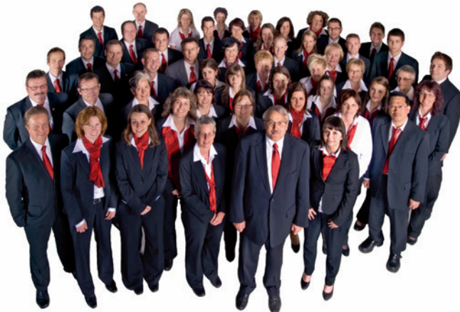
Das Team der Raiffeisenbank Seeland

Raiffeisen möchte KMU-Betriebe noch mehr unterstützen. Gerade kleine und mittlere Unternehmen müssen hin und wieder in die Firma investieren, um konkurrenzfähig zu bleiben. Wir bieten eine breite Basispalette für den Finanzalltag eines KMU-Betriebes. Der KMU-Kunde steht bei uns zu Recht im Zentrum der persönlichen und individuellen Beratung.