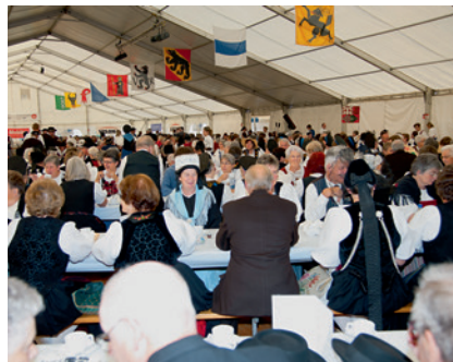
Mehrere hundert Stimmberechtigte nahmen an der Delegiertenversammlung der Schweizerischen Trachtenvereinigung (STV) teil.