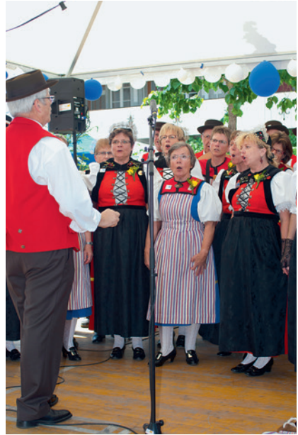
Freies Singen auf einer Aussenbühne.

Zitat aus einem Brief der Schweizerischen Trachtenvereinigung an das OK: «Das Trachtenchorfest in Lyss war geprägt von professionel-