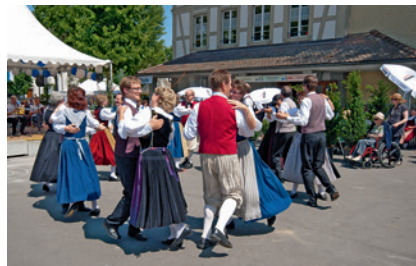
Ein Tänzchen da...

40 Laienschauspielern auf. Ergänzt wurden die Festtage mit einer Ausstellung «Trachten im Kanton Bern» und der Präsentation von Trachtenhandwerk wie Filigrans Schmuck, Stroh flechten oder Rosshaarspitze klöppeln.