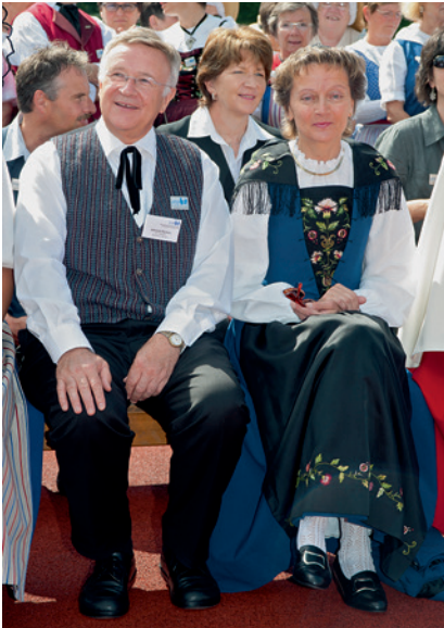
Festrednerin Bundesrätin Eveline Widmer-Schlumpf und OK-Präsident alt Nationalrat Albrecht Rychen.

Im friedlichen Wettstreit trugen 64 Chöre ihre Lieder vor, liessen sie nach eigenem Wunsch von einer Fachjury bewerten oder trugen mit ihren freien Vorträgen zum Gelingen des Festes bei. Mehrere tausend Besucher freuten sich zum Abschluss des dreitägigen Festes am farbenfrohen Umzug durch den Seeländer Ort.