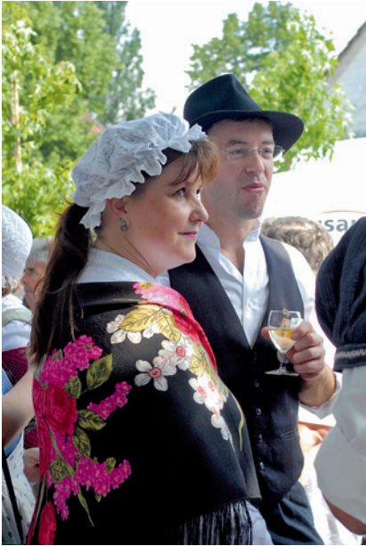
...ein Gläschen hier.