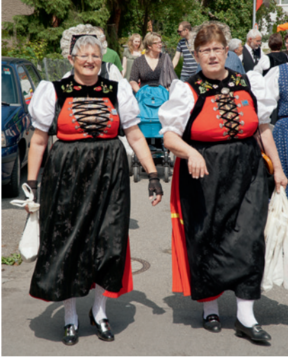
Buntes Leben in der Festgasse.