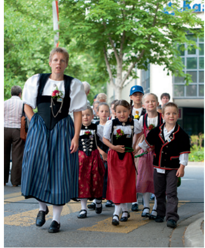
Der Nachwuchs kommt.