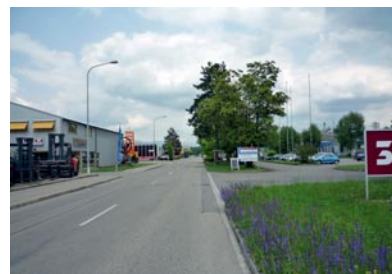
Der Industriering Nord soll gestalterisch aufgewertet und für Velofahrer sicherer werden.

Das Konzept hat für die Grundeigentümer keine Verbindlichkeit, sondern dient der Verwaltung zur Orientierung. Seine Umsetzung kann sich über längere Zeit erstrecken. Verschiedene Massnahmen sind in der Investitionsplanung 2010-2015 bereits berücksichtigt, andere werden erst dann eingeleitet, wenn Werkleitungs- oder Belagssanierungen anstehen. Eine Ausnahme bildet die Verlängerung des Wegs entlang dem Lyssbach, welche eine hohe Priorität hat.