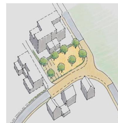
Durch kleine Platzgestaltungen entstehen einprägsame, quartiertypische Orte.

Prägnante Hauptverkehrsachsen, markante Plätze, klar ablesbare Ortseingänge, ein grosses Grünraumangebot und vor allem der Lyssbachraum bilden die Stärken der öffentlichen Räume von Lyss. Daneben gibt es aber auch Defizite: Verschiedene Haupt- und Quartierstrassen sind wenig attraktiv gestaltet, teilweise fehlen Verbindungswege von den Quartieren ins Zentrum oder zwischen den Quartieren. Das Konzept öffentlicher Raum macht Vorschläge, wie dies längerfristig verbessert werden könnte.