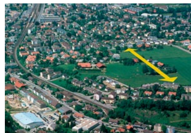
Vom Quartier Murgeli in Richtung Erli ist eine neue Wegverbindung geplant.