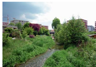
Der Weg entlang dem Lyssbach soll in Richtung Industrie Nord und Suberg verlängert werden.